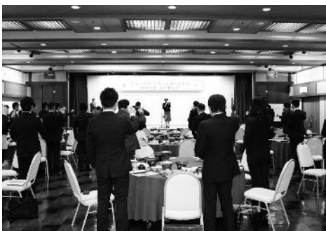
臨時総会忘年懇親会の様子

さて、12月の青年部は委員会活動にHOW TO 青年部、そして大切な臨時総会とあります。皆それぞれいろんな立場、スタンスをもつて青年部活動に参加されていらっしゃるが、まだ、自身のスタンス(将来どういう風になりたい、どうしたい)が確立されていない若い情熱のある方がいらっしやいましたら、私たちが一緒に夢を語り合い自分探しをしてみませんか? 青年部に入会お待ちしております。