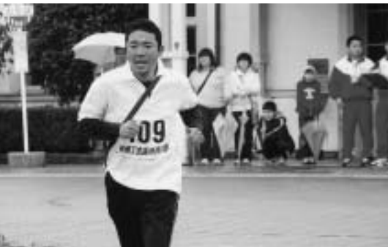
雨天の中、沿道よりのご声援ありがとうございました