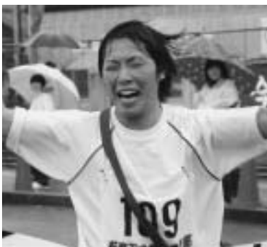
皆の思いを繋いで、今感動のゴール!